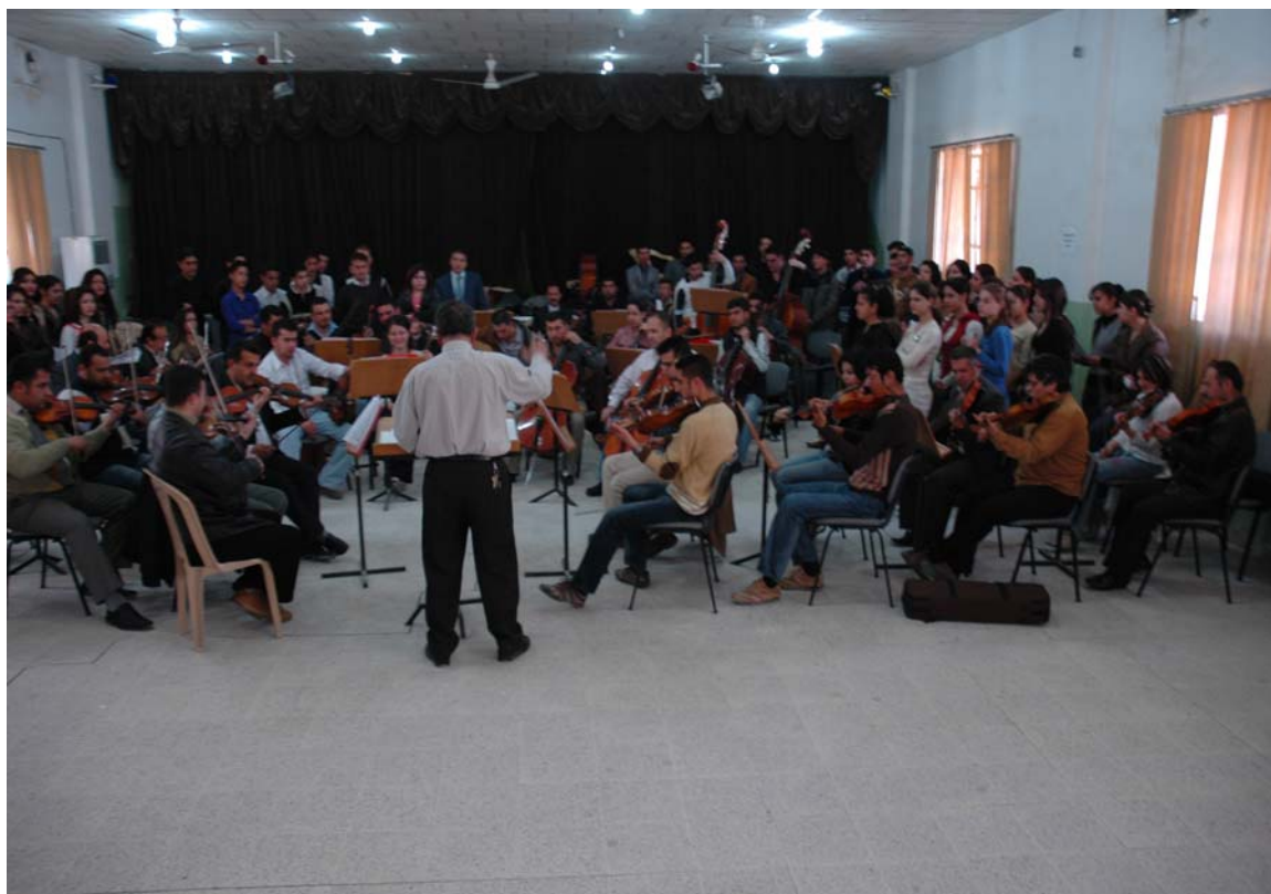
تیپی مۆسیقای سهههیمانی ۲۰۰۷